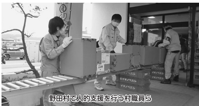
野田村で人的支援を行う村職員ら

に伴い利用しやすくなっているが、川部北部の踏切は非常に段差が激しく、通る度に大変気を遣う。現地は住宅街の中にあり非常に危険なので改良をお願いしたい。