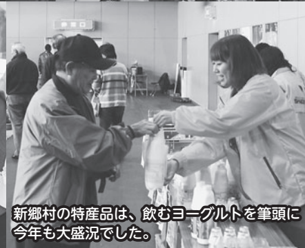
新郷村の特産品は、飲むヨーグルトを筆頭に 今年も大盛況でした。