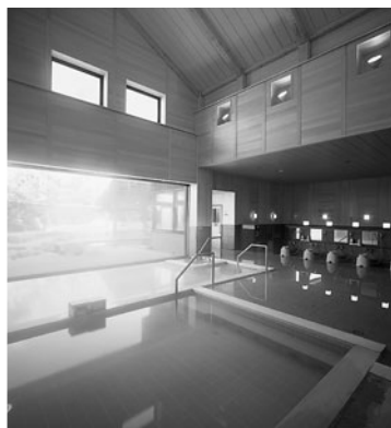
▲趣の異なる浴場を日替わりでお楽しみください