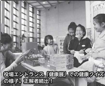
役場エントランス「健康展」での健康クイズ の様子。正解者続出!