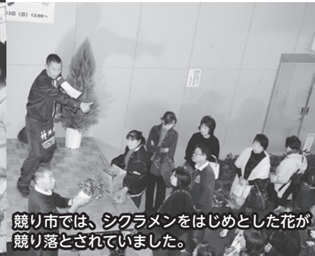
競り市では、シクラメンをはじめとした花が 競り落とされていました。