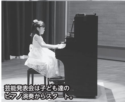
芸能発表会は子ども達の ピアノ演奏からスタート。

また、三戸郡から新郷村が今年も参加し、特産品のシタケや飲むヨーグルトを販売。特設ブースに並べられた商品は次々と売れ、好評を博していました。