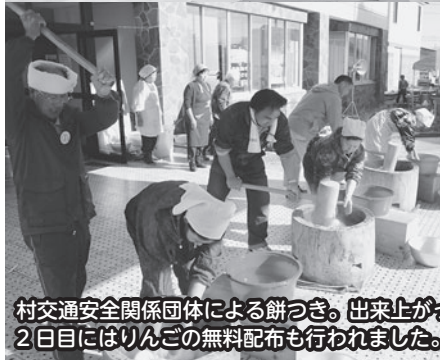
村交通安全関係団体による餅つき。出来上がった3色餅はその日のうちに無料配布。 2日目にはりんごの無料配布も行われました。