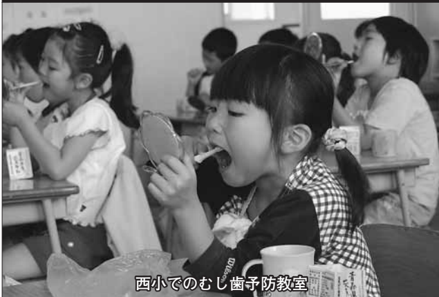
西小でのむし歯予防教室