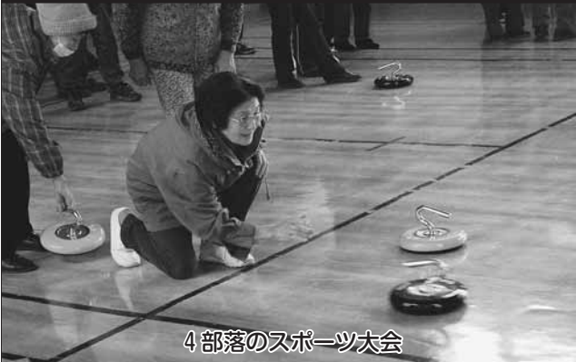
4部落のスポーツ大会