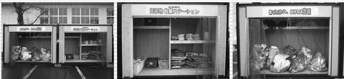
資源物収集ステーション（役場正面駐車場内）