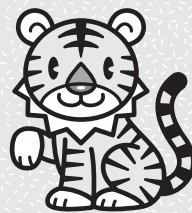
村内の年男・年女（11月末現在）