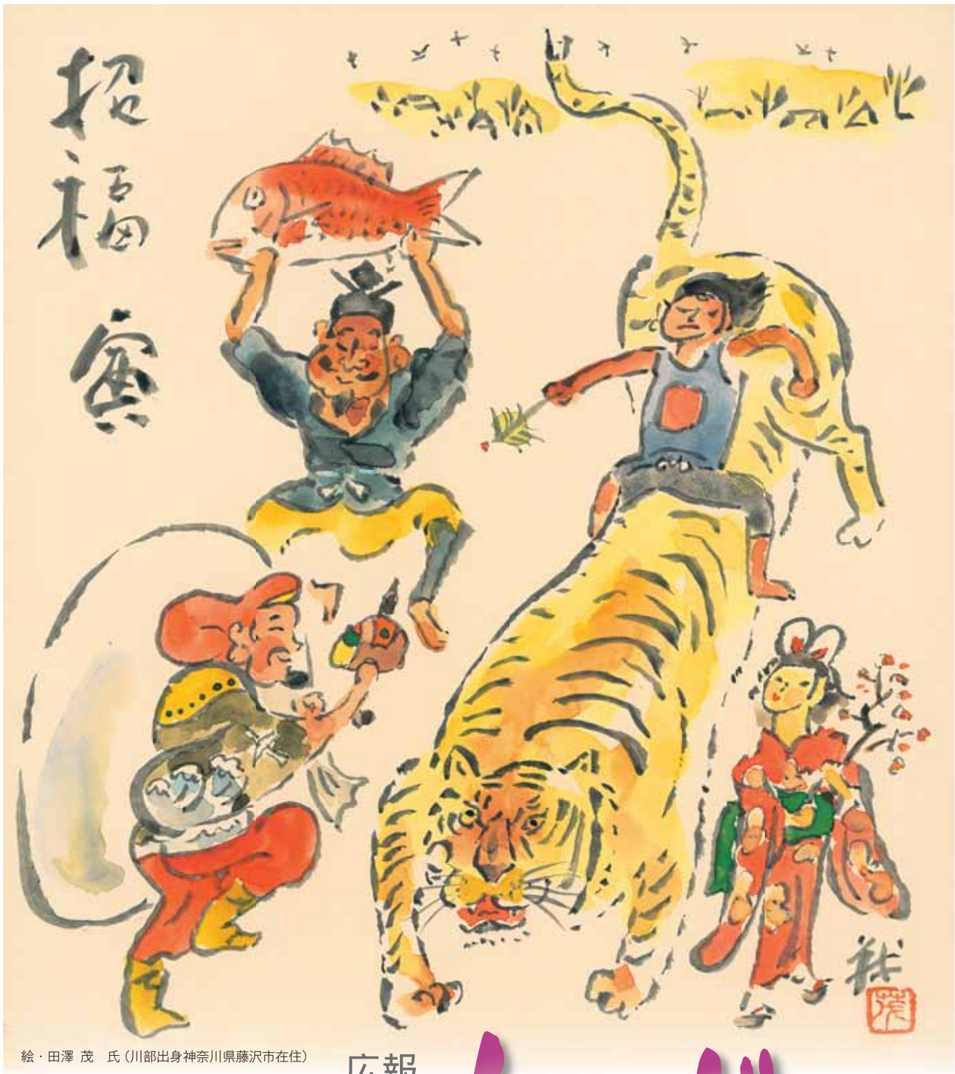
絵・田澤茂氏(川部出身神奈川県藤沢市在住)