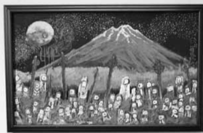
▲今回新たに展示された「縄文の里」(左)と「千の風の唄」(右)