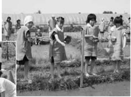
▲5月24日、田舎館小学校では恒例の弥生水田の田植えを、5・6年生が行いました。