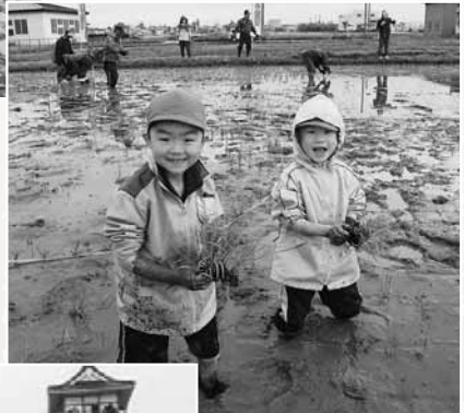
▲保育園の園児達も田植えに参加。大はしゃぎでした。