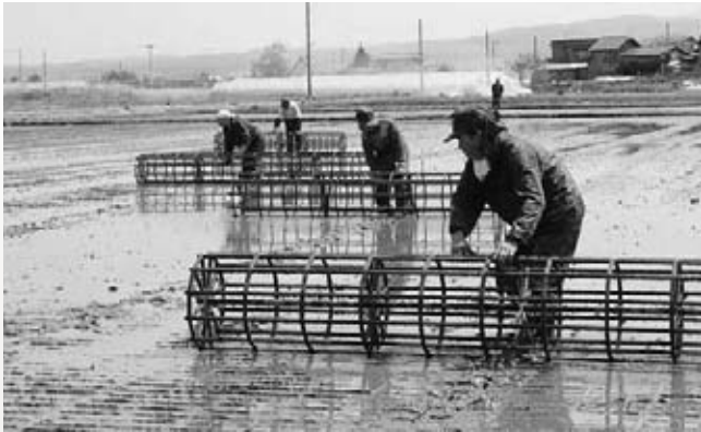
△「型ころがし」の作業です。