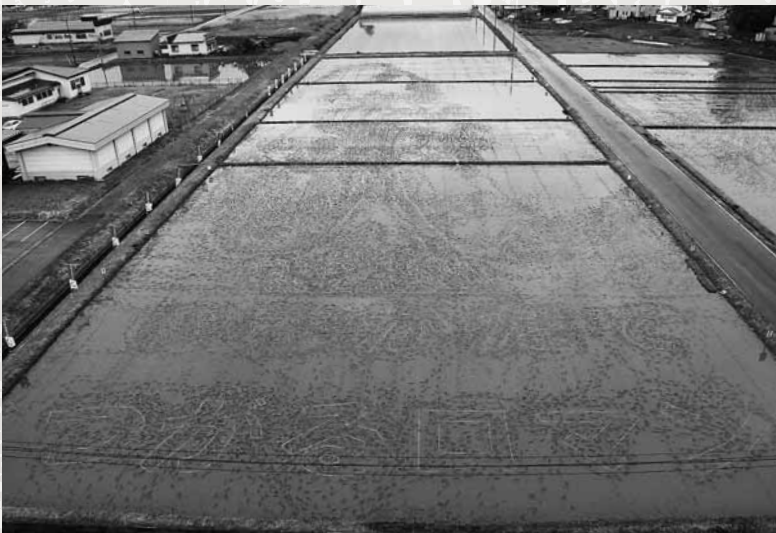
△「田植え体験ツアー」当日の朝の様子。開始前は静けさが漂っています。

5月27日、「第15回田植え体験ツアー」が役場東側水田で開催され、あいにくの天候の中、総勢約700人が参加し、1万5,000平方メートルの水田に巨大なアートを描きました。