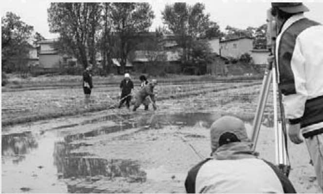
△長さ・角度を計測し、図柄に合わせて棒(かや)を差します。