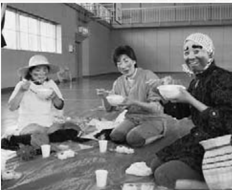
▲大阪、札幌、大館から参加したという「温泉仲間」の方々。