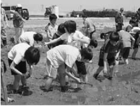
▲5月22日、光田寺小学校では、1年生から6年生までの全校生徒が田植えを行いました。

5月中旬以降は田植え作業のピークを迎え、村内の各小学校でも学校田の田植えが行われました。それぞれの小学校の田植えも天候が良く、絶好の田植え日よりとなりました。児童達は土の感触に戸惑いながらも、元気いっぱい田植えを行いました。児童達はこれからも天気にも恵まれることを願い、秋の収穫がとても待ち遠しい様子でした。