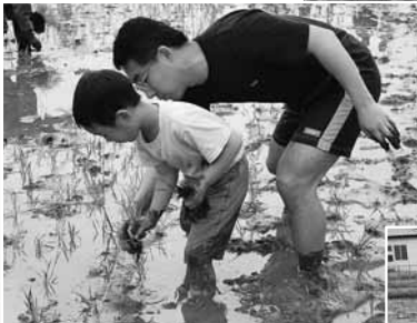
▲今年もたくさんの親子が参加しました。