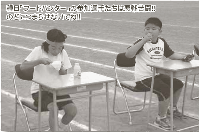
種目「フードハンター」の参加選手たちは悪戦苦闘!! のどにつまらせないでね!!

田舎館村の夏の恒例行事である村民体育レクリエーション大会が7月15日、田舎館中学校グラウンドで開催され、子どもからお年寄りまで幅広い世代が多数参加しました。当初、大会当日の天気予報は“雨”でしたが、村民の思いが伝わったのか天気は晴れ。普段あまり運動していない人も、この日ばかりは「運動不足解消」と張り切っていました。大会は最後の種目リレー競技まで大盛り上がりでした。