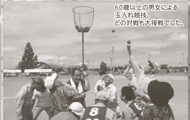
60歳以上の男女による 玉入れ競技。 どの対戦も大接戦でした。