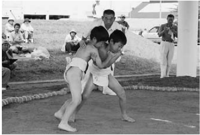
熱戦が続いた個人戦。表情が真剣そのもの。

続いて個人戦では、まず保育園児たちから取組を行った後、小学校低学年、高学年と続き、元気いっばいの相撲を繰り広げました。結果は次のとおり。