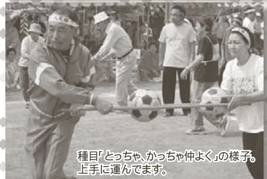
種目「とっちゃ、かつちゃ仲よく」の様子。 上手に運んでいます。