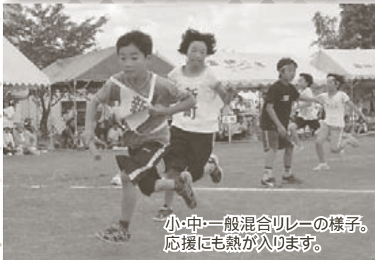
小・中・一般混合リレーの様子。 応援にも熱が入ります。