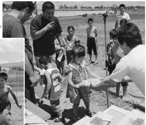
▲入賞した子どもたちは、賞品をくじ引きしました。