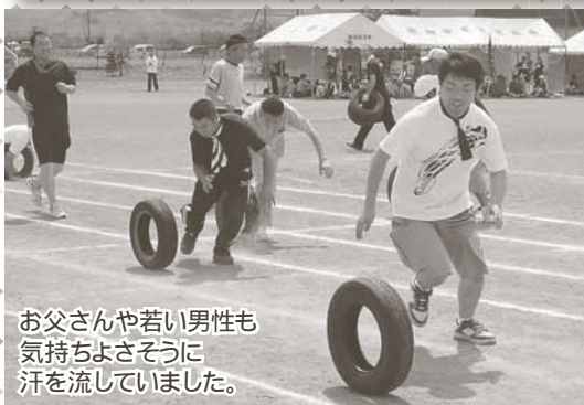
お父さんや若い男性も 気持ちよさそうに 汗を流していました。