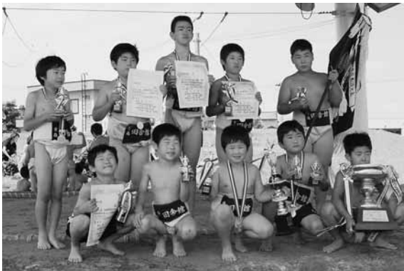
見事団体優勝を飾った田舎館小学校の“力士”たち