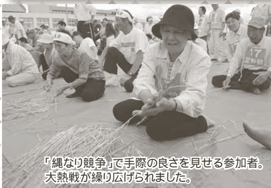
「縄なり競争」で手際の良さを示せる参加者。 大熱戦が繰り広げられました。