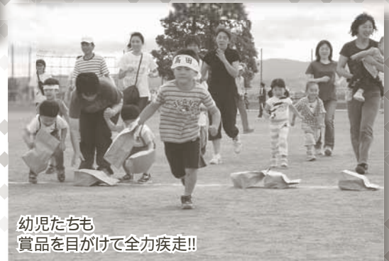
幼児たちも 賞品を目掛けて全力疾走!!