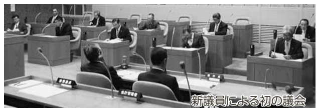
新議員による初の議会