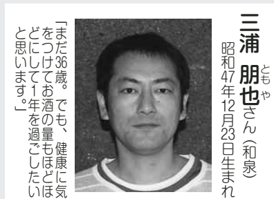
村内の年男・年女 (11月末現在)