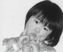
「毎日はみがきやってるよ〜!」