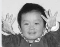
「はみがきががんばったよ!」