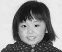
「はみがき大好きです!」