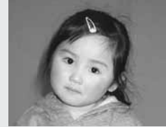
「はみがきががんばってるよ!」