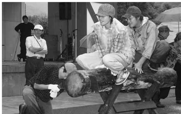
▲自由参加ですのでぜひ！