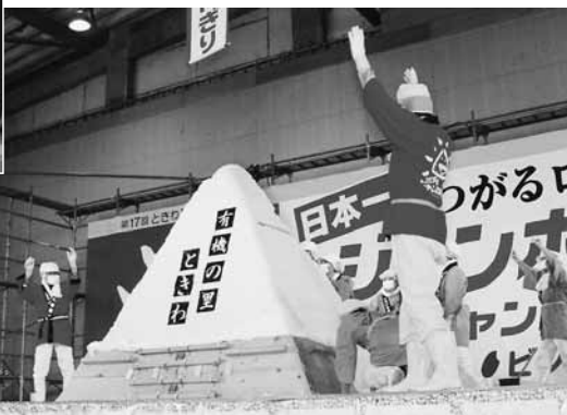
▼見事に完成したジャンボおにぎり