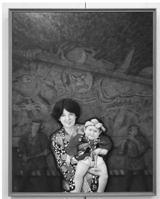
▲奥さんと娘さんをモデルに描いた「望郷」