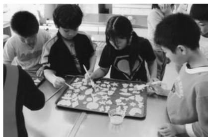
▲菓子工房での体験のようす