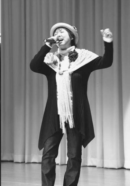
話題沸騰中！特別審査員の『ピートまりお母』。パワフルな歌声も披露してくれました。