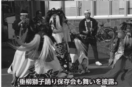
垂柳獅子踊り保存会も舞いを披露。