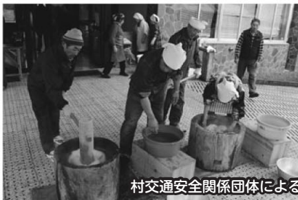
村交通安全関係団体による餅つきとりんごの無料配布。