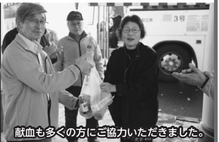
献血も多くの方にご協力いただきました。