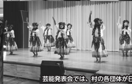
芸能発表会では、村の各団体が日頃の練習の成果を発表しました。