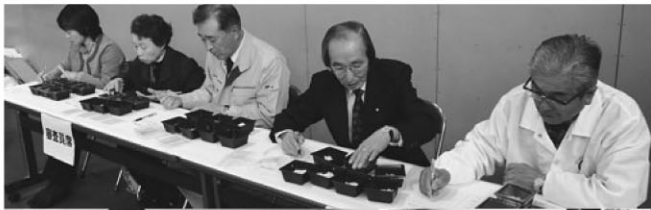
米食味鑑定コンクールでは審査の後、来場者への試食も行われました。