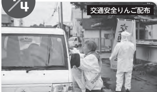
交通安全りんご配布