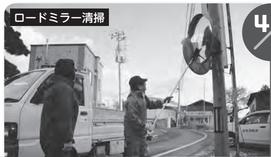
ロードミラー清掃