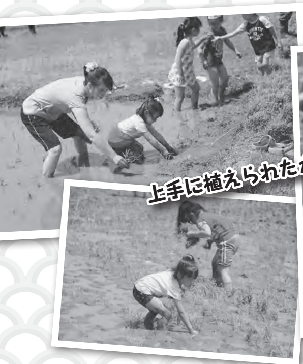
上手に植えられたかな?