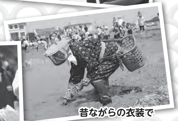
昔ながらの衣装で