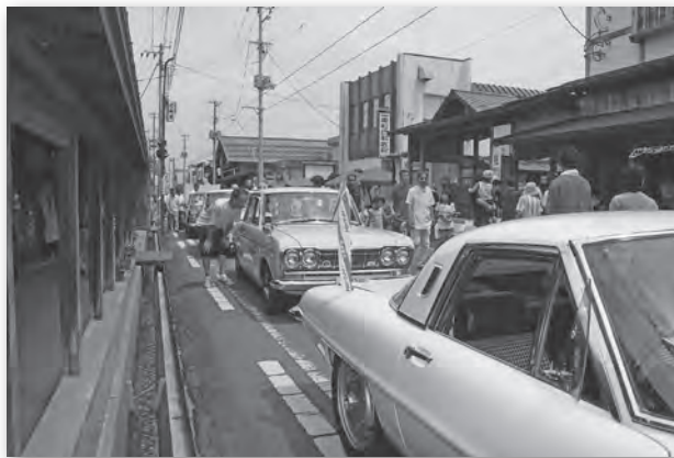
たくさんのお車が集結