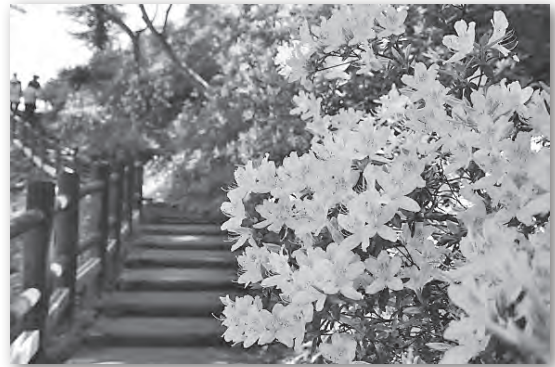
温泉街を眼下に見ながら、小高い丘を縫うように遊歩道は続きます