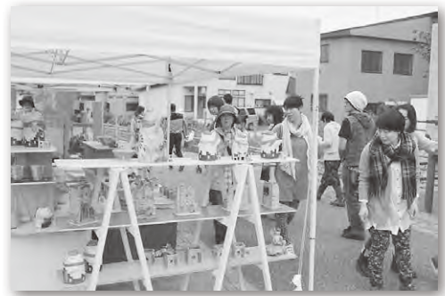
自慢の作品が勢揃い