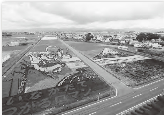
第1田んぼアート「富士山と羽衣伝説」