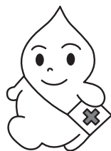
青森県の献血キャラクター「ブラッド君」