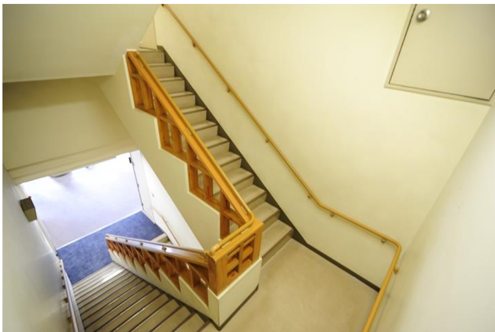
〈 4階以上の階段の様子 〉