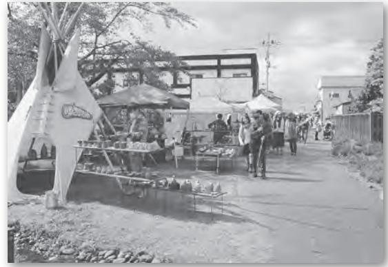
2.1kmの小径に作品がずらり