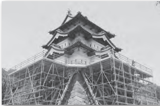
曳屋工事開始を待つ弘前城天守