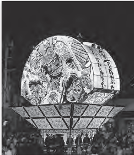
高さ11mの世界一の扇ねぶたも出陣します