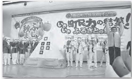
迫力の「ジャンボおにぎり」