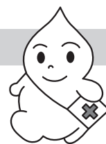
青森県の献血キャラクター「ブラット君」