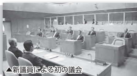
▲新議員による初の議会