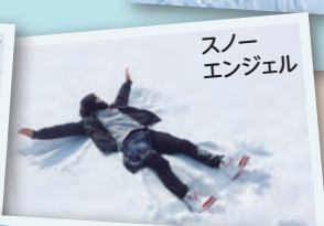
スノーエンジェル