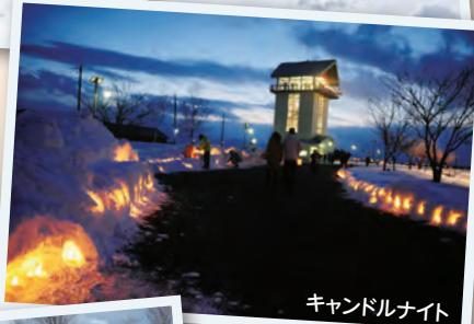
キャンドルナイト