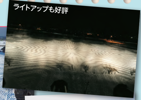
ライトアップも好評