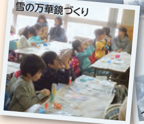
雪の万華鏡づくり