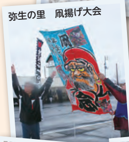
弥生の里 凧揚げ大会