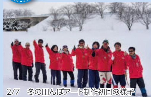
2/7 冬の田んぼアート制作初目の様子

1月25日、冬の田んぼアート2020の開催に向け、スノーアーティスト集団 It's OK.の会員9人が弘前市の岩木山総合公園多目的グラウンドでスノーアートの試作を行いました。会員はデザイン図を基に、線の長さに合わせて歩数や、修正点の有無を確認しながら約4時間かけて試作に取り組み、本番へ向けて図案を仕上げていました。