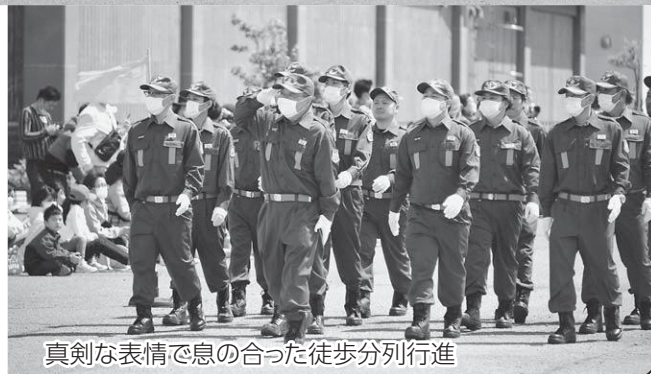
真剣な表情で息の合った徒歩分列行進

5月3日、県南黒地区消防協会の観閲式が、JRAウインズ津軽駐車場で行われました。南黒地区の各消防団から合わせて1,600人と車両103台が参加し、分列行進や纏振りなどで防災意識と団結力を高めました。