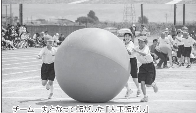
チーム一丸となって転がした『大玉転がし』