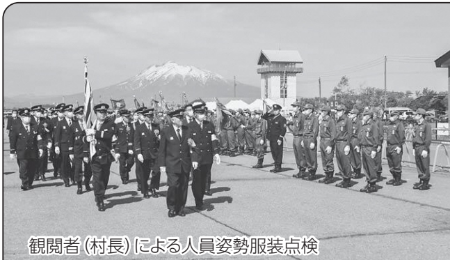
観閲者(村長)による人員姿勢服装点検