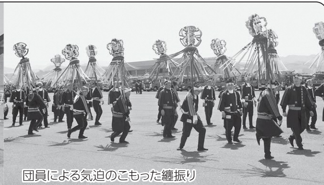
団員による気迫のこもった纏振り