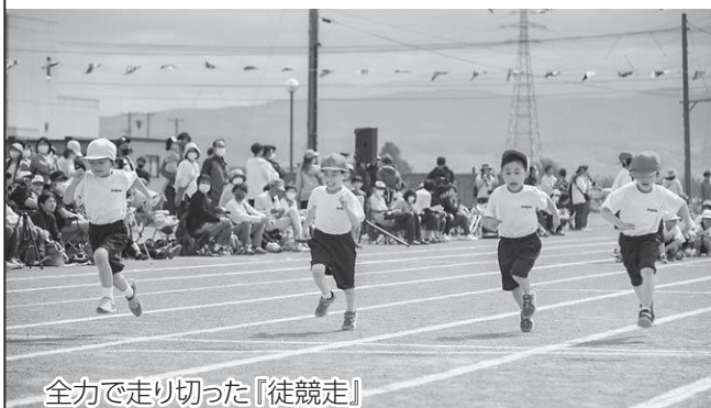
全力で走り切った『徒競走』