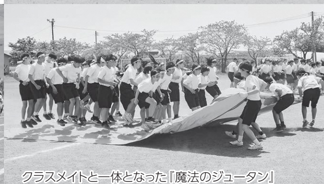
クラスメイトと一体となった『魔法のジュータン』