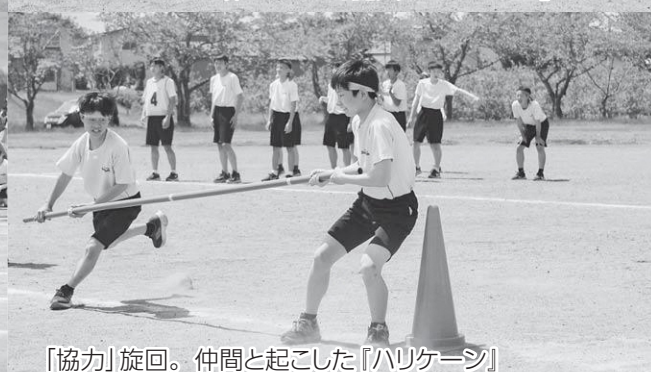
「協力」旋回。仲間と起こした『ハリケーン』