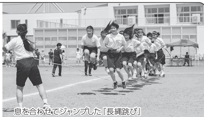
息を合わせてジャンプした「長縄跳び」

児童、生徒たちは徒競走や障害物競走、団体演技などで日頃の練習の成果を発揮していました。