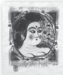
所蔵：棟方志功記念館

色の異なる稲を使い、田んぼをキャンバスに描きます。今年は、「門世の柵と真珠の耳飾りの少女」、「ONE PIECE」がテーマです。